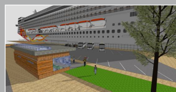
Alta er en viktig cruisehavn i N-Norge.