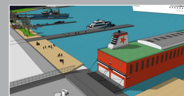
Alta Havn tilrettelegger for rullende gods og spesialtransporter over kai til et moderne veinett for videre-transport i Finnmark.

Bukta havneområde ligger beskyttet til i umiddelbar nærhet til E6 og flyplass, og kun 2 km fra Alta sentrum. Hovedaktiviteten her er transport av gods, varer og persontrafikk.