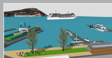
Alta Havn KF deltar aktivt i å utvikle effektiv- og sikker sjotransport.