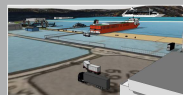
De store transportørene er etablert i Alta. Ny bil-til-bil terminal planlegges nå.