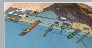
Nye og effektive kailøsninger i samråd med brukerne.